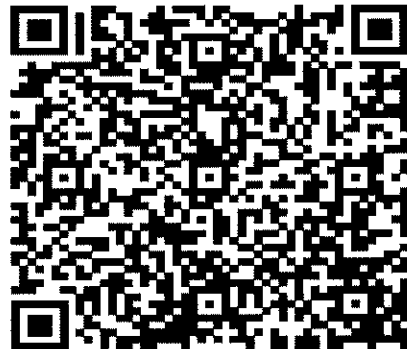
เดือนพฤษภาคม