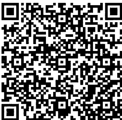
เดือนมิถุนายน